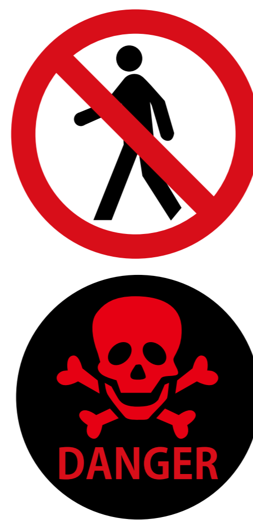
一般色覚者の見え方

危険な状態を知らせる看板や、表示など、人の生命にかかわるサインで、赤ベースに黒文字などの色弱者が見えにくい配色の看板が使われている事があります。