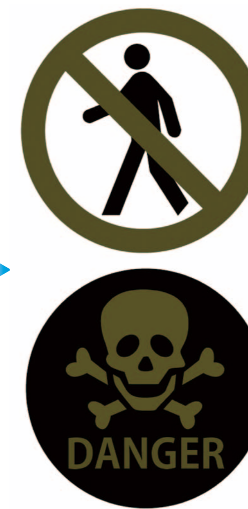
色弱者(P型)の見え方